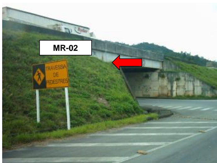
Foto panorâmica do marco MR-02.