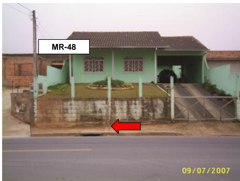
Foto panorâmica do marco MR-48.