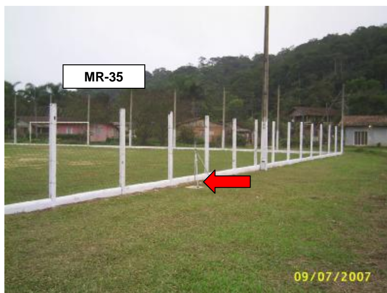
Foto panorâmica do marco MR-35.