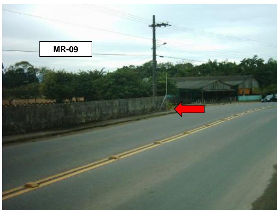
Foto panorâmica do marco MR-09.