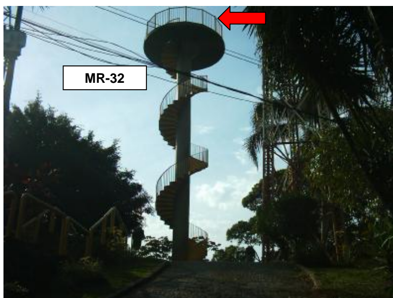
Foto panorâmica do marco MR-32.