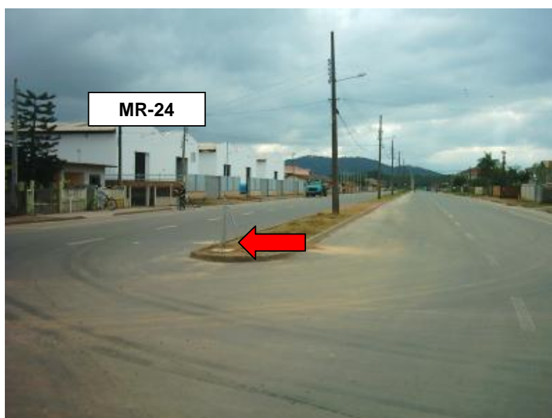
Foto panorâmica do marco MR-24.